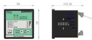
TH212 V2 - Relé de proteção para ventilação